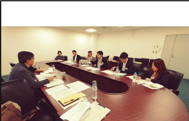
KRILA · CLAIR · GRIPS 10주년 공동세미나 추진 회의