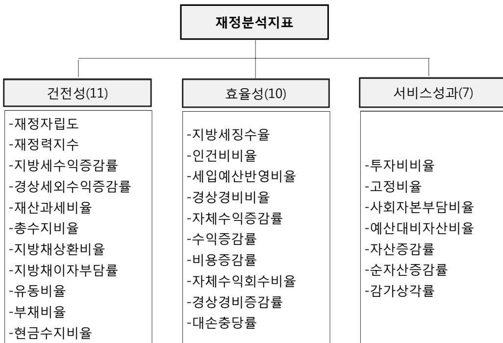
<그림1> 28개 지방재정분석지표의 체계도